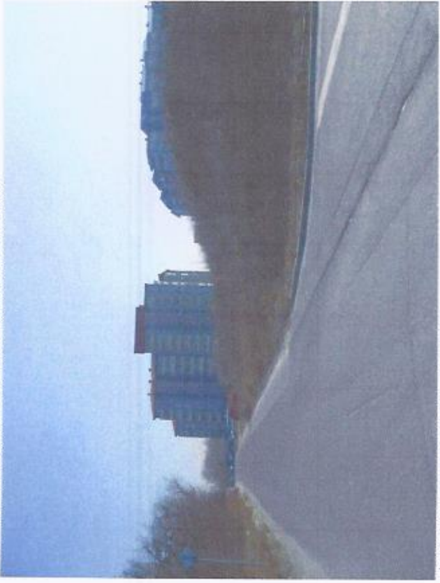
NÁROŽNÝ POHLAD Z ULICE AGÁTOVÁ - HRUBÁ LÚKA