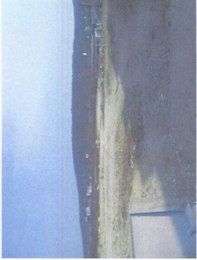
POHLAD Z JZ OJPU POZEMKU NA POZEMOK