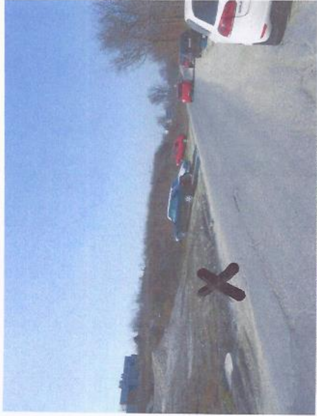
POHLAD Z AGÁTOVEJ ULICE, V POZADÍ NA LAVEJ STRANE BUDOVA TESCO