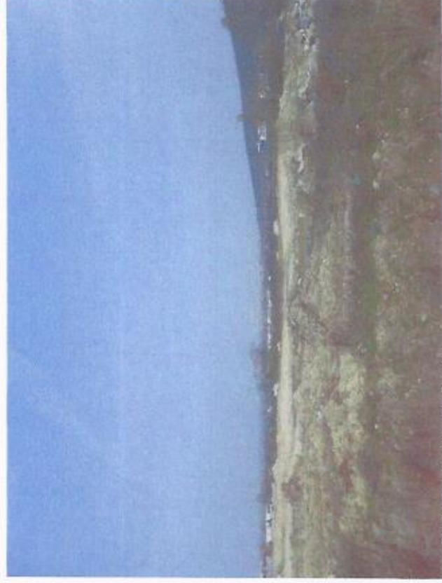
POHLAD Z JZ OJPU POZEMKU NA POZEMOK